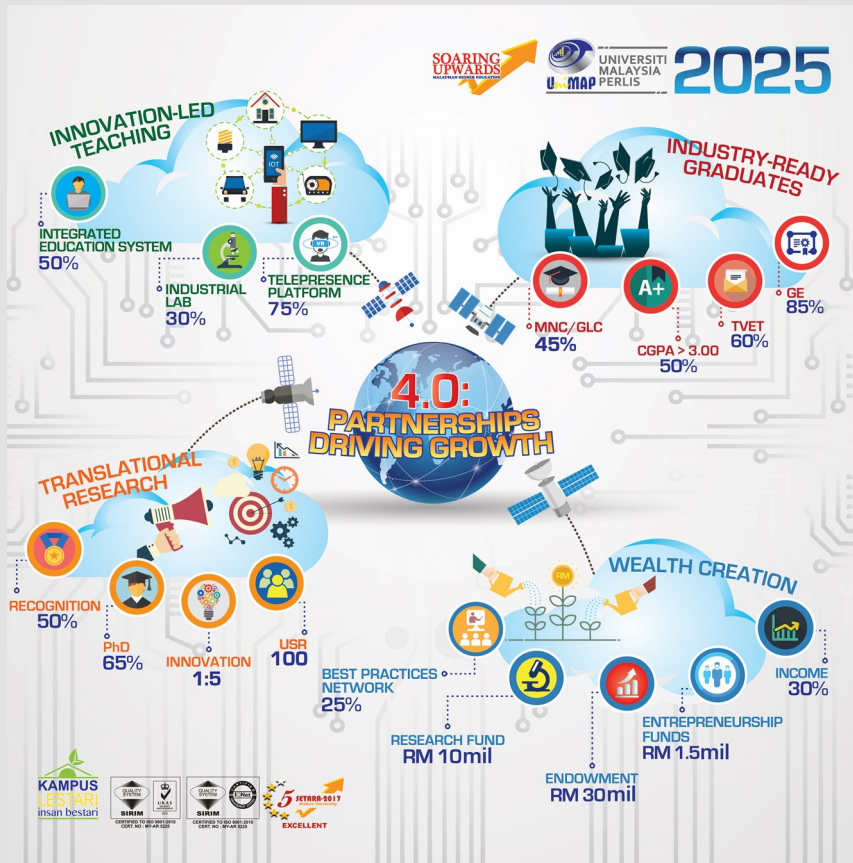
Rajah 2: Pelan Strategik UniMAP 2025

Kerangka Strategik UniMAP 2025 telah dibina berdasarkan Pelan Strategik UniMAP 2025: 4.0 Perkongsian Memacu Pembangunan (Rajah 2) Pelaksanaan Kerangka Strategik UniMAP 2025 adalah didasari oleh nilai teras UniMAP iaitu Ilmu, Keikhlasan, Kecemerlangan .