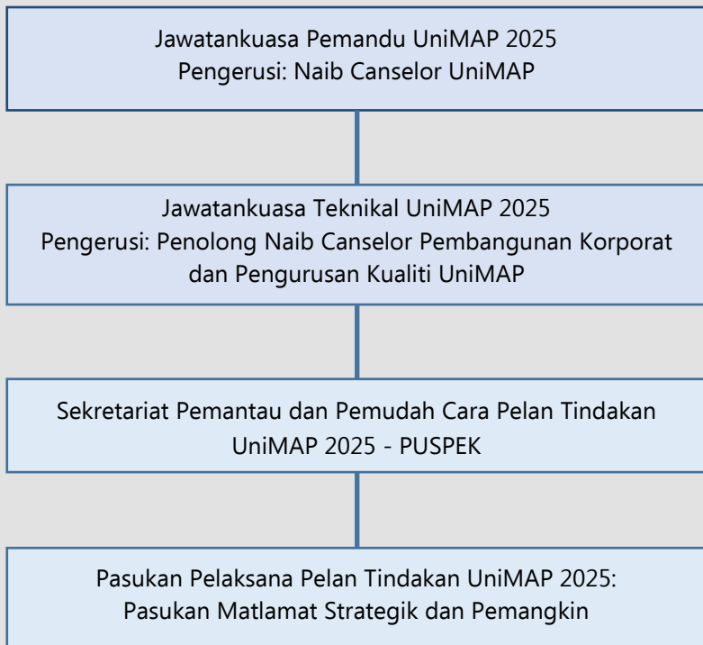
Rajah 4: Struktur Governan UniMAP 2025

Pelaporan pencapaian setiap objektif strategik akan dibentangkan kepada Pengurusan UniMAP setiap suku tahun melalui Jawatankuasa Pemandu UniMAP 2025. Hal ini penting dalam memastikan terdapat keselarasan antara setiap matlamat strategik dan pemangkin, ke arah mencapai hasrat besar dan objektif utama UniMAP 2025. Mekanisme ini juga membantu pihak Pengurusan UniMAP menilai, secara kolegial, aspek-aspek pembangunan setiap matlamat strategik dan pemangkin serta dapat menangani cabaran dan isu yang timbul, dari perspektif yang lebih besar, agar pelaksanaan lebih lancar dan teratur yang seterusnya akan membawa kepada kejayaan UniMAP 2025.