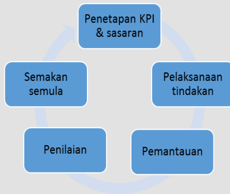
Rajah 3: Proses Penambahbaikan berterusan Pelan Tindakan UniMAP 2025

Usaha-usaha yang berjaya membawa kepada pencapaian sasaran yang ditetapkan dalam Pelan Tindakan ini akan dikumpulkan dalam repositori amalan baik ( good practices repository ) UniMAP. Sementara itu, tindakan penambahbaikan boleh diambil ke atas tindakan-tindakan yang tidak menjurus kepada kejayaan yang diharapkan. Hal ini akan membolehkan berlakunya pembelajaran melalui pengalaman dalam kalangan mereka yang terlibat, yang seterusnya akan membawa manfaat dalam aspek pengurusan dan pembangunan UniMAP 2025 khasnya, dan UniMAP secara amnya. Proses penambahbaikan berterusan bagi setiap matlamat strategik dan pemangkin sebagai pendekatan yang diambil dalam pengurusan Pelan Tindakan ini ialah seperti di bawah: